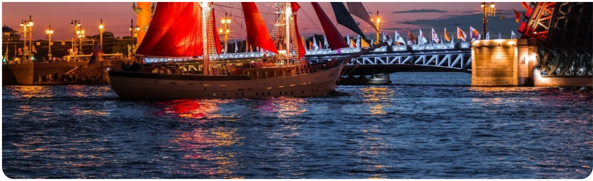
Проход фрегата "Россия" по Большой неве