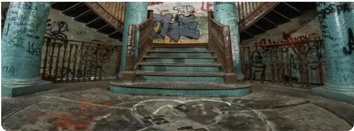
Пешеходная экскурсия "Легенды Мистического Петербурга"