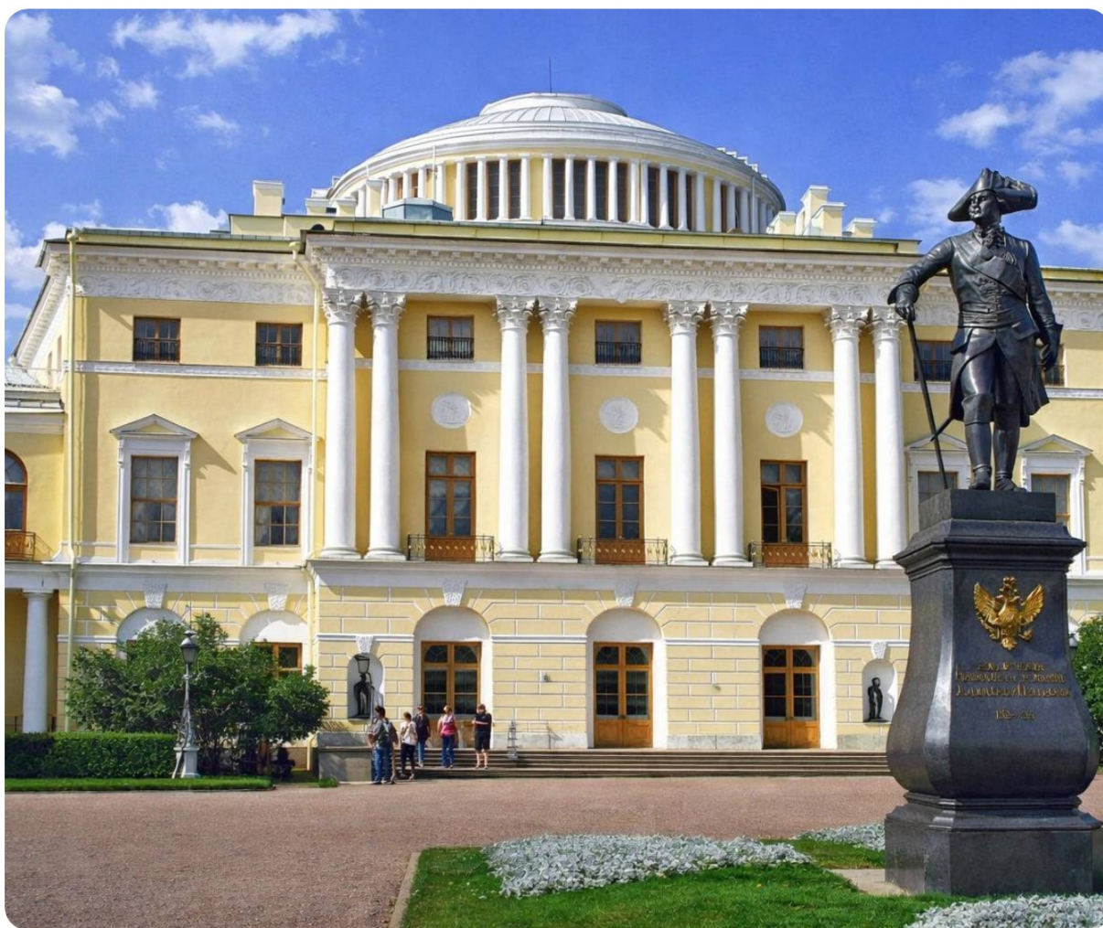
Экскурсия в Павловск в Павловский дворец